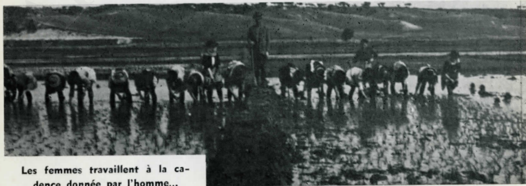
Les femmes travaillent à la cadence donnée par l'homme...

Comment pourrait-il mener la guerre coloniale sur trois fronts s'il n'était pas fortement et efficacement soutenu par ses alliés de l'O.T.A.N. ?