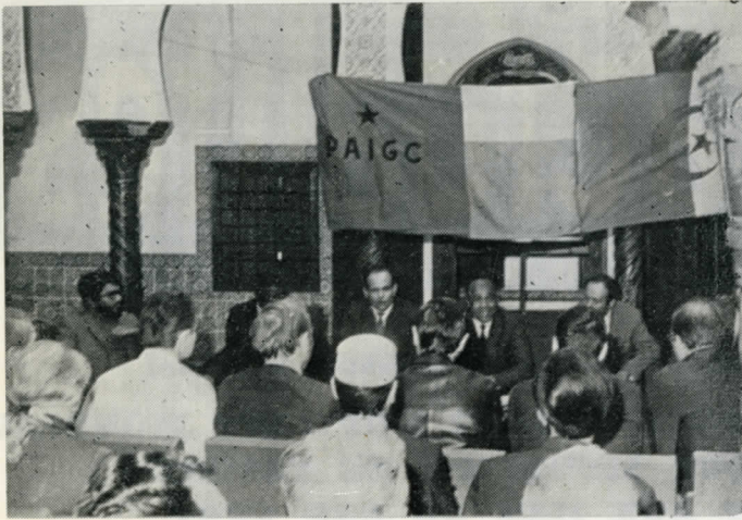
Dans le cadre des salons de la villa Boumaraf, décorés des drapeaux algérien et de notre Parti, le camarade Amilcar Cabral tient son importante conférence de presse.