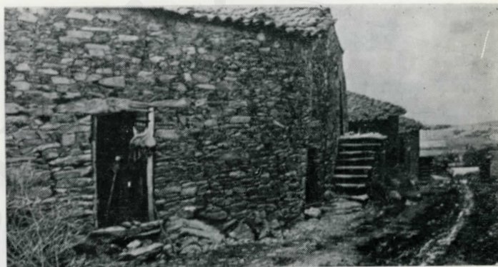
La majeure partie de la population agricole ne trouve pas à s'employer pendant la moitié de l'année.

le gouvernement du Portugal est incapable de promouvoir le progrès de son propre pays.