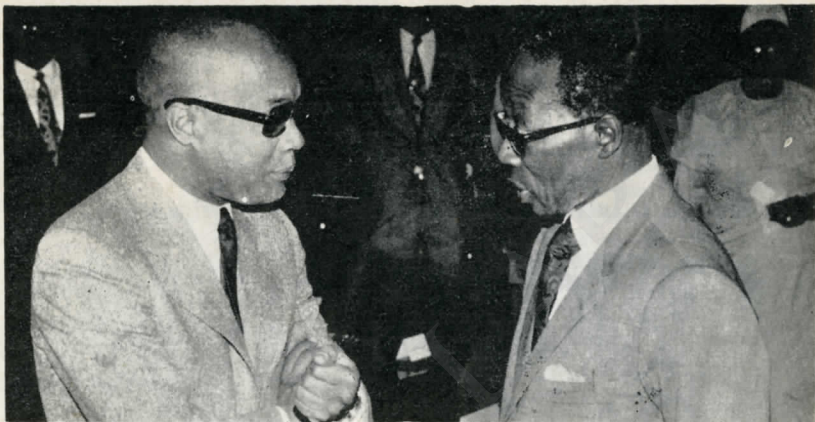
Les deux leaders africains s'entretenant pendant une interruption des travaux du Congrès.

DAKAR — Le Secrétaire Général du Parti, accompagné du camarade Luiz CABRAL, du Comité Exécutif de la Lutte, assiste, sous l'invitation du Bureau Politique de l'U.P.S., aux assises du VIII e Congrès de l'Union Progressiste Sénégalaise. Après sa brillante allocution chaleureusement applaudie par les congressistes, notre leader est reçu au Palais de la République par le Chef de l'Etat sénégalais, S.E. Léopold Sédar Senghor, Secrétaire Général de l'U.P.S. qui réaffirme le soutien fraternel du peuple et du gouvernement du Sénégal à notre Parti. Le camarade Amilcar Cabral a également eu des entretiens avec S.E. Abdou Diouf, Premier ministre, et d'autres membres du Gouvernement.